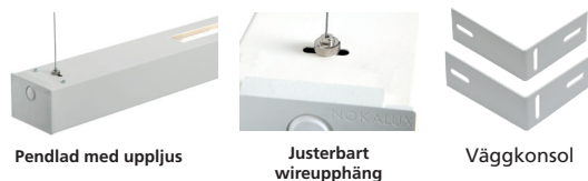
Pendlad med uppljus

Kan förses med dragströmbrytare. Livslängd L80 Ta25 100 000h (B50) MacAdam 3 SDCM CRI: >80 | CE Energiklass (LED modul): C, D