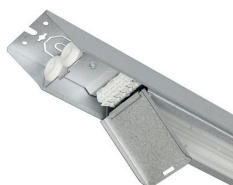
Inkoppling med lucka