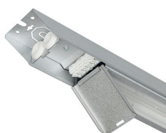
Inkoppling med lucka